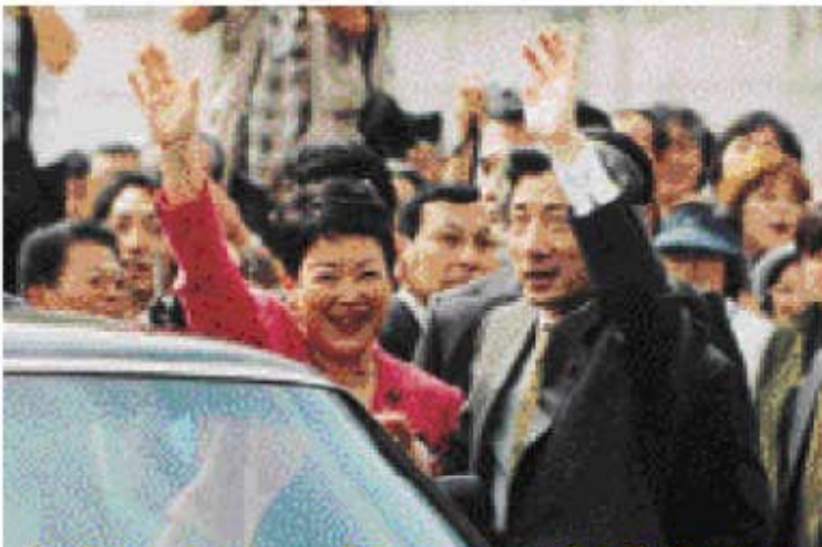
小泉総裁遊説の ワンシーン